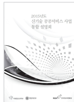
2015년도 신기술 공공서비스 사업 통합 설명회