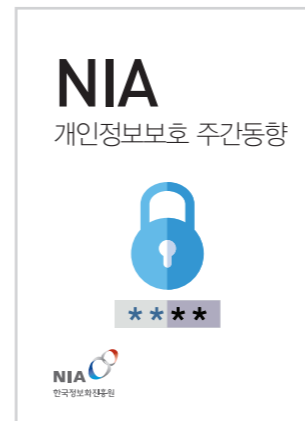
[제98호] NIA 개인정보보호 주간동향