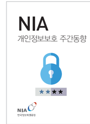
[제90호] NIA 개인정보보호 주간동향