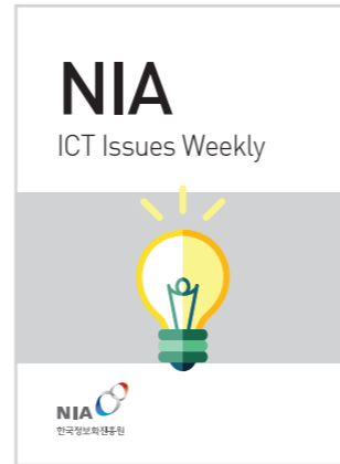
[ICT Issues Weekly 485호] 영국, 사물인터넷(IoT) 스타트업 투자 지원 등