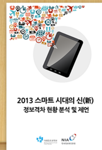
2013 스마트시대의 신(新) 정보격차 현황 분석 및 제언