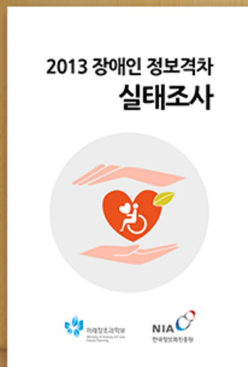
2013 장애인 정보격차 실태조사