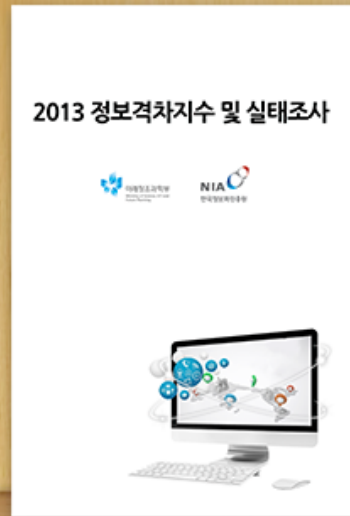
2013 정보격차지수 및 실태조사