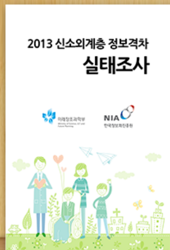
2013 신소외계층 정보격차 실태조사