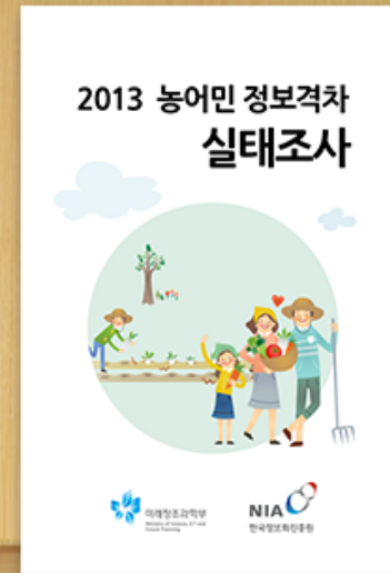
2013 농어민 정보격차 실태조사