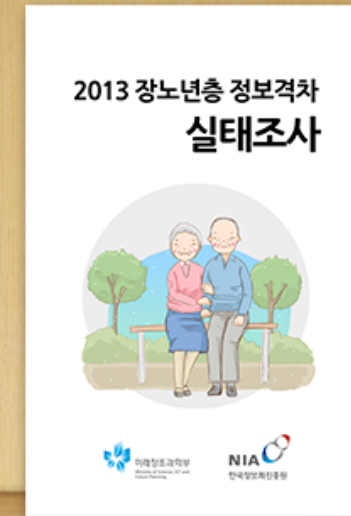
2013 장노년층 정보격차 실태조사